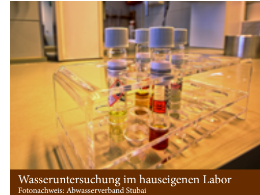
Wasseruntersuchung im hauseigenen Labor

Bis zum Jahr 2001 übernahm diese Aufgabe eine Anlage mit dem so genannten „Belebtschlammverfahren“ (übliches Ver-