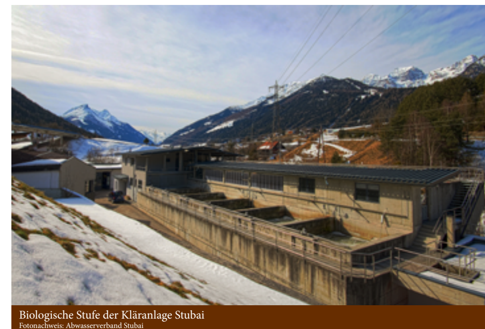
Biologische Stufe der Kläranlage Stubai

Doch durch das technisch hohe Niveau des Klärwerkspersonals und deren hervorragenden fachlichen Kenntnisse in Bezug auf Abwasserreinigung, kann durch Umbauten und Optimierungen ein sehr guter Reinigungsprozess erreicht, sowie die Ablaufwerte ständig im gesetzlichen Rahmen gehalten werden.